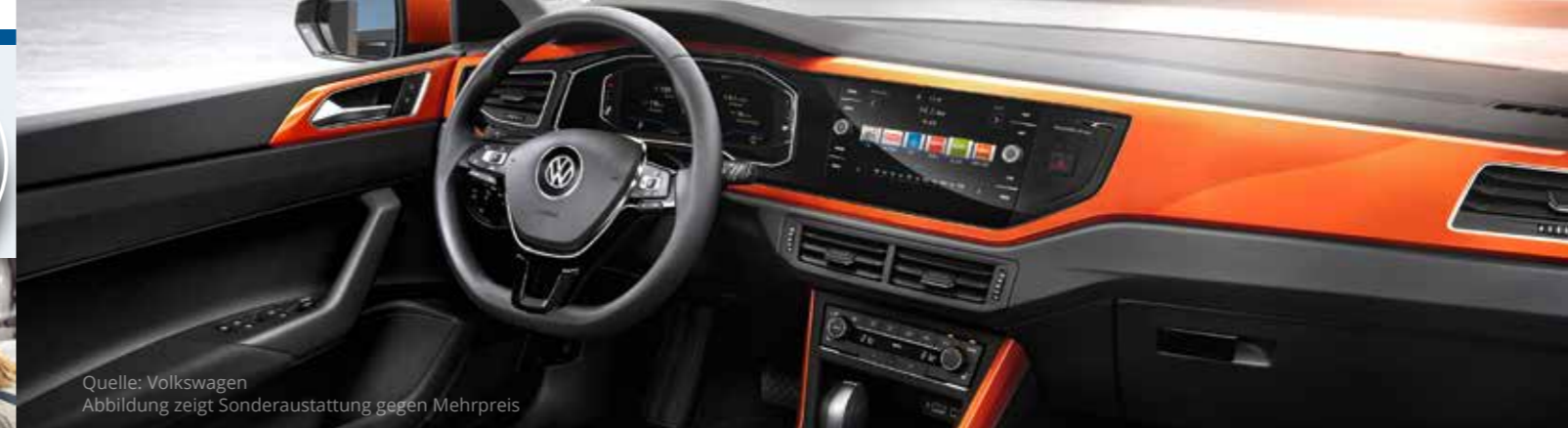
Abbildung zeigt Sonderausstattung gegen Mehrpreis